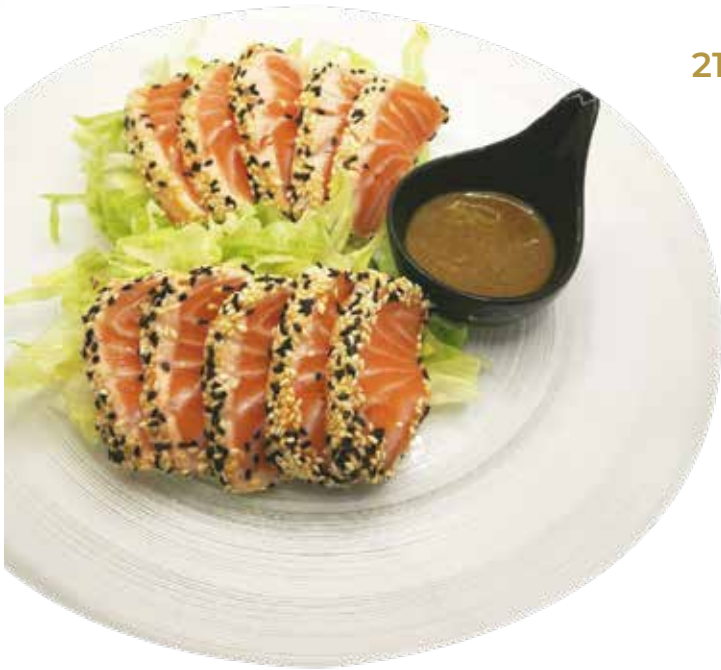
215. SALMONE TATAMI 11,00€