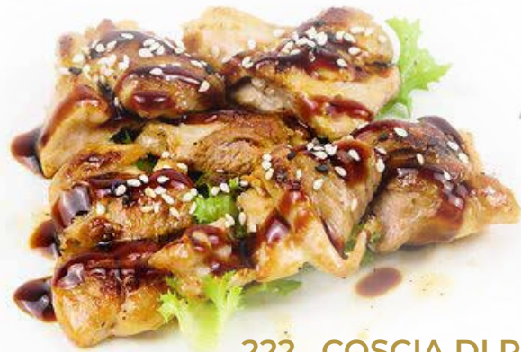
222. COSCIA DI POLLO ALLA PIASTRA 9,00€