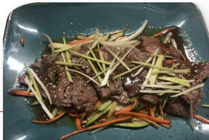
224. MANZO CON VERDURE ALLA PIASTRA 11,00€