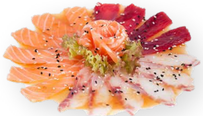
114. CARPACCIO DI PESCE MISTI 14,00€