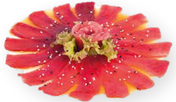
111. CARPACCIO DI TONNO 12,00€