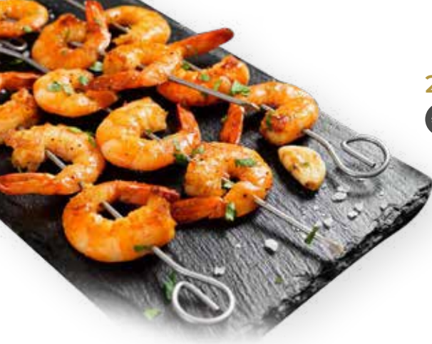
219. SPIEDINI DI GAMBERO 10,00€