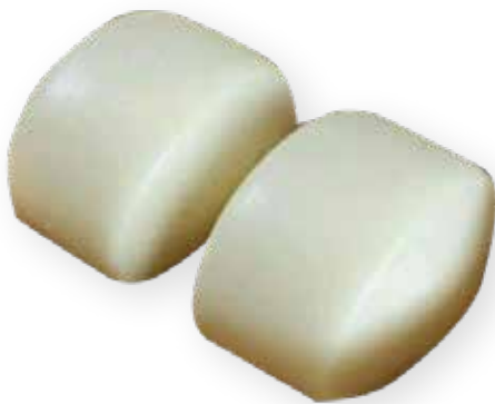
26A PANE AL VAPORE CON CREMA 4,00 €