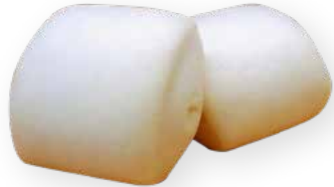
25A PANE AL VAPORE