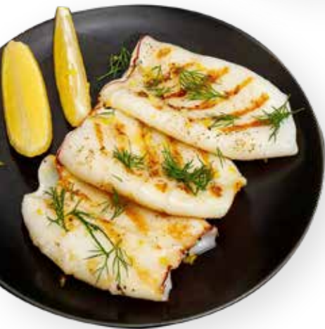
223. CALAMARI ALLA PIASTRA 9,00€