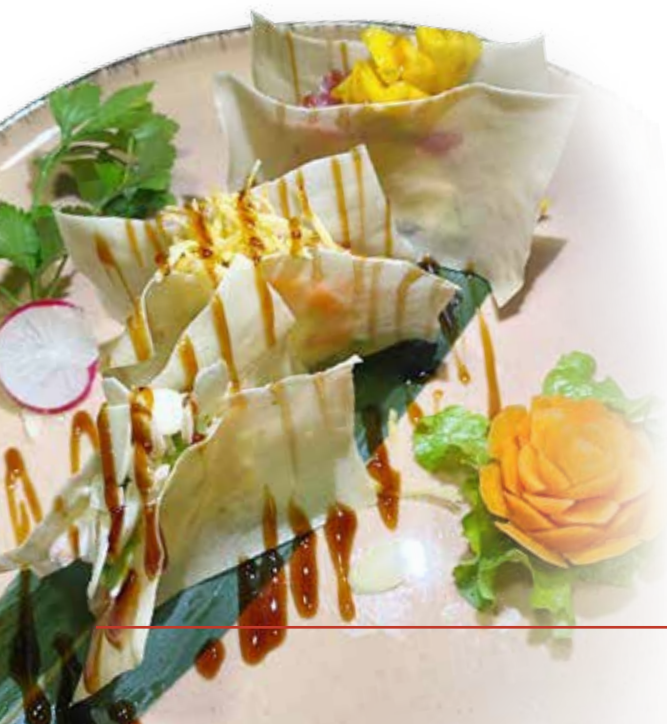
28A SANDWICH COOKIES SUSHI 8,00€

3pz - involtini con salmone,tonno, gambero cotto, philadelphia, mango, avocado, tobiko, salsa a scelta: maionese, maionese piccante o Teriyaki .