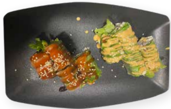
27A SPRING ROLL SUSHI 10,00€

8pz - involtino con insalata .avocado Philadelphia salmone tobiko e salsa maionese piccante, maionese e salsa teriyaki