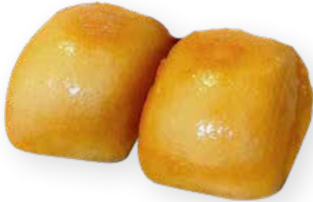
24A PANE FRITTO 3,00 €