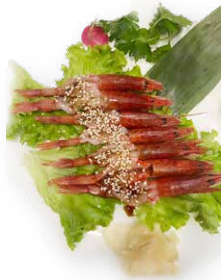
113. CARPACCIO DI GAMBERO ROSSO 14,00€ 8pz